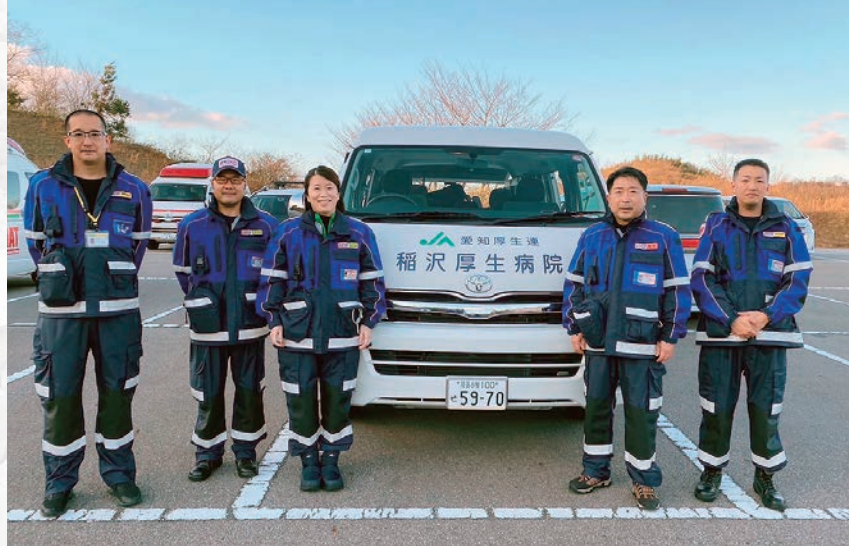
稲沢厚生病院DMAT隊員

令和6年能登半島地震により、お亡くなりになられた方々のご冥福をお祈りいたしますとともに、被災された皆様によりお見舞い申し上げます。