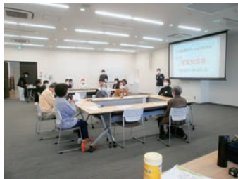
参加者の方が語り合う様子

2021年11月13日、第1回目となる「看取りを経験されたご家族の交流会」を訪問看護ステーションそぶえにて開催しました。当日は、13名の方にご参加いただき、顔なじみの訪問看護師らと語らいのひとときを過ごされました。