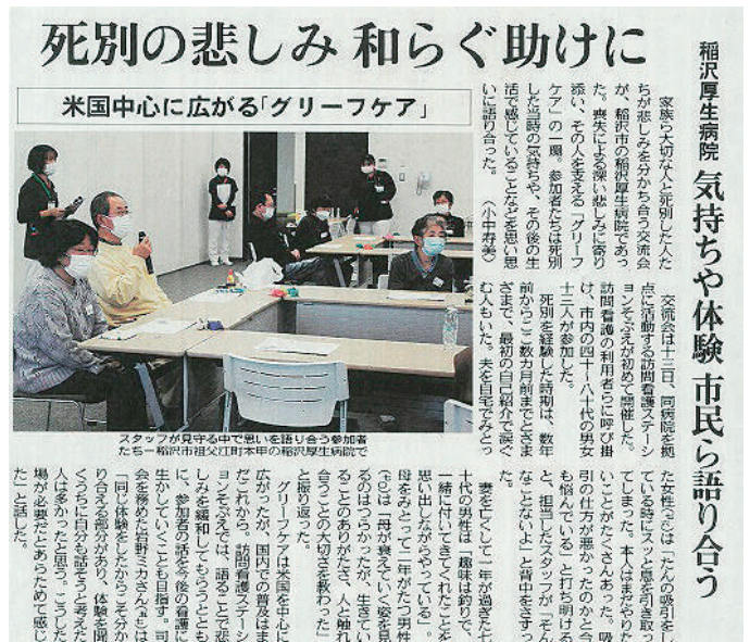
中日新聞 2021年11月17日尾張版に掲載された実際の記事