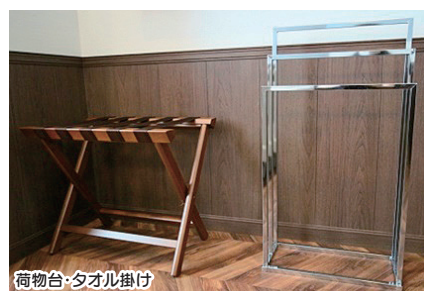
荷物台・タオル掛け