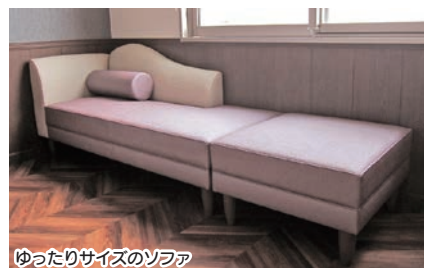
ゆったりサイズのソファ