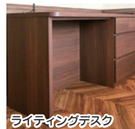
ライティングデスク