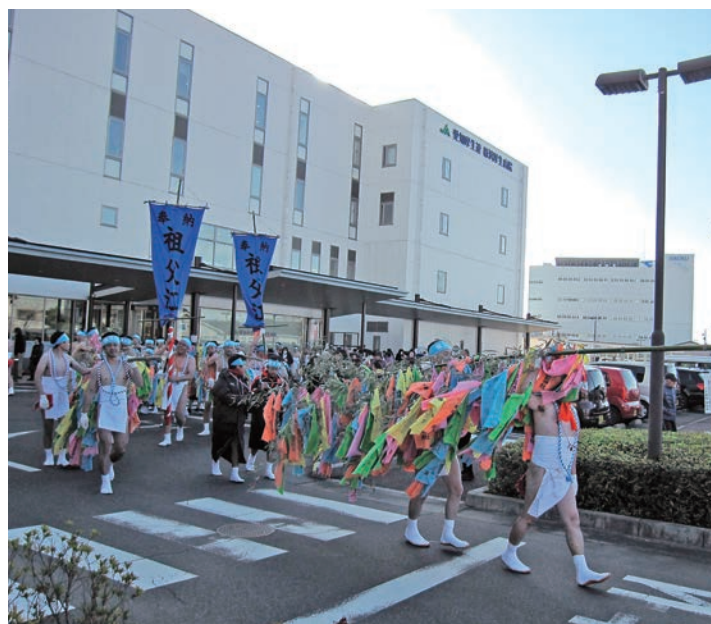
国府宮はだか祭り